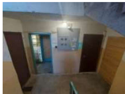
1.stāva kāpņu telpa