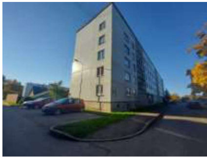
Dzīvojamā māja Saules ielā 12