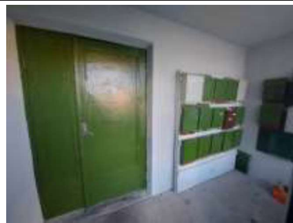
ieeja kāpņu telpā