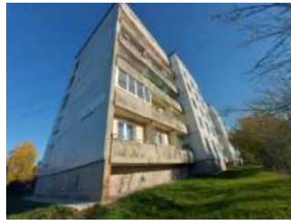
Dzīvojamā māja Saules ielā 12