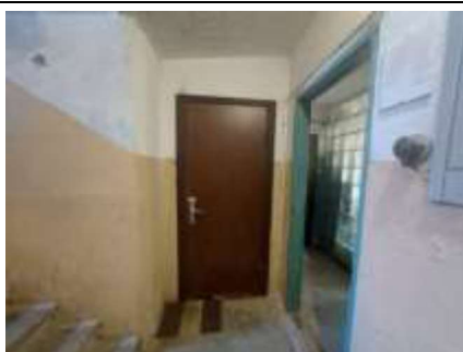
Dzīvokļa Nr.20 ieejas durvis