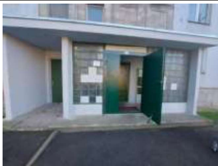
ieeja kāpņu telpā